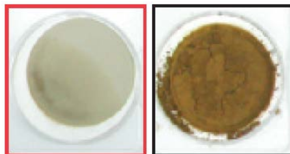
HYDREX AW 46 2684 часа